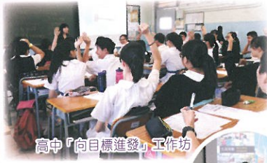
高中「目標邁進」工作坊