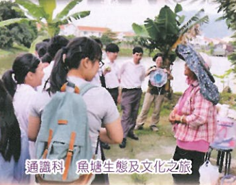
通識科 魚塘生態及文化之旅