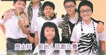
歷史科 原始人話劇比賽