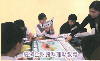
經濟企財跨科理財教育

時光荏苒，轉眼今年畢業的學生已進入中大、科大、城大及理大等接受高等教育。可見本校致力提升學生的學習效能。