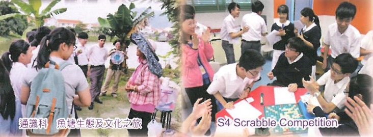
S4 Scrabble Competition