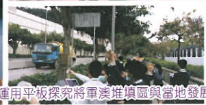
運用平板探究將軍澳堆填區與當地發展