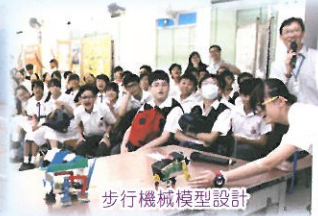
步行機械模型設計