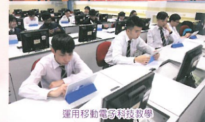
運用移動電子科技教學