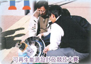
可再生能源設計及競技大賽

透過認識設計程序、材料分析，引導學生掌握基本設計原則，認識及運用基本的工藝技能，繼而進一步掌握基本電腦繪圖技巧，進行產品模擬設計如步行機械模型等。