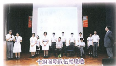
十組服務隊伍就職禮