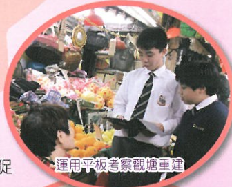
運用平板考察觀塘重建