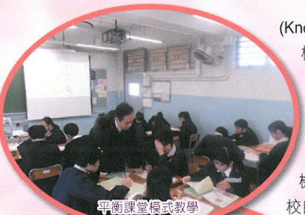
平衡課堂模式教學