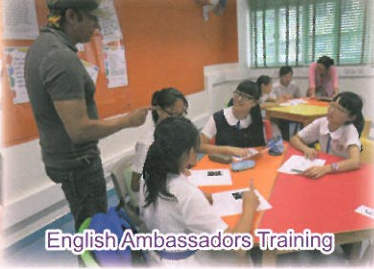
English Ambassadors Training