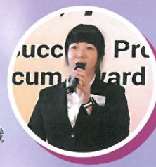
Success Precum Award

是次得到 CYMA Charity Fund Scholarship ，是一個令她意想不到的收穫。她還記得初期成績未如理想，故其後用上更多的精神與時間努力學習，雖然過程令她碰過、傷過，甚至想過放棄，但她認為只要不讓失敗成為停止自己向前走的藉口，相信仍然可以走出自己的路。