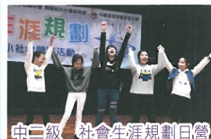
中二級 社會生涯規劃日營