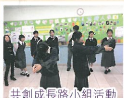
共創成長路小組活動