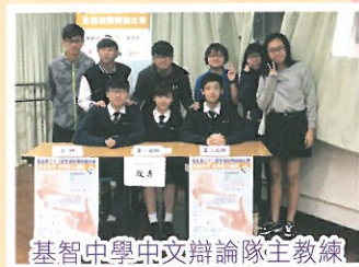
基智中學中文辯論隊主教練

另外，他也利用訓練和比賽以外的時間和隊員多作溝通，建立亦師亦友關係，令學生更願意學習，達致教學相長，互補不足。