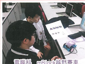
電腦科 mBlock 越野賽車

本校STEM教育課程發展小組，策劃於不同學科滲入科學，技術，工程，數學元素，透過體驗學習及跨科協作，讓學生增強綜合和應用跨學科的知識與技能的概念和能力，啟發創意潛能，嘗試解決真實問題，以適應未來科技發展的新趨勢。