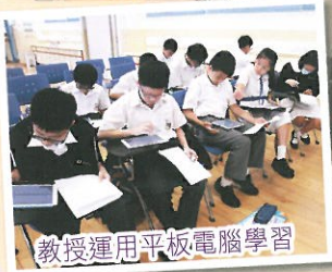
教授運用平板電腦學習