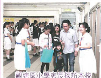
觀塘區小學家長探訪本校