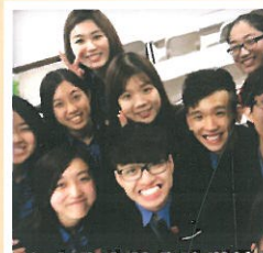
中文大學崇基學院辯論隊