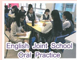
English Joint School Oral Practice