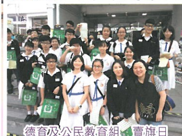
德育及公民教育組 賣旗日