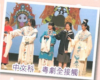
中文科 粵劇全接觸