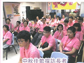
中秋佳節探訪長者