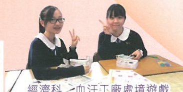
經濟科 血汗工廠處境遊戲