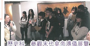
歷史科 參觀末代皇帝溥儀展覽