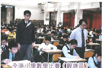
全港小學數學比賽(觀塘區)