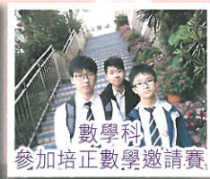
數學科 參加培正數學邀請賽