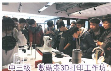
中三級 數碼港3D打印工作坊