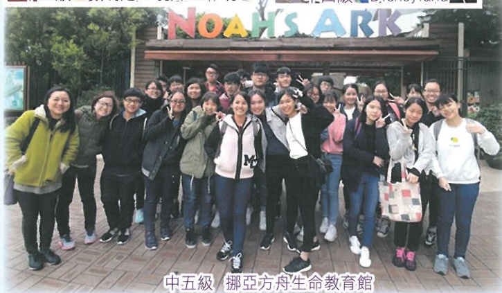
中五級 挪亞方舟生命教育館