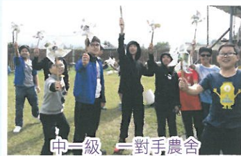
中一級 一對手農舍

中四級則藉迪士尼樂園之旅，從中探究全球化議題，寓學習於遊樂。中五級到挪亞方舟生命教育館，透過多元化活動，使學生加深認識自己，尋找未來的目標。「全方位學習日」不但能擴闊同學視野及豐富生活體驗，更能培養學生對學習的興趣，發展共通能力，成為積極及勇於面對挑戰的新一代。