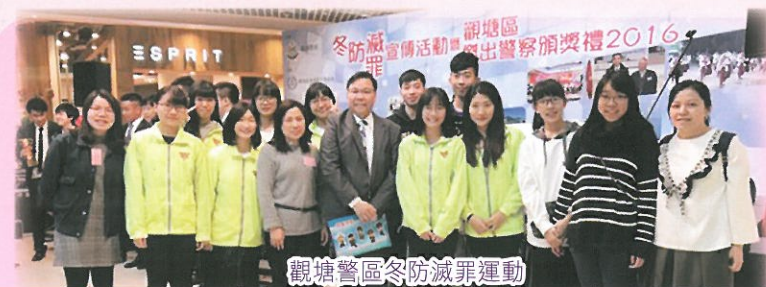
觀塘警區冬防減罪運動