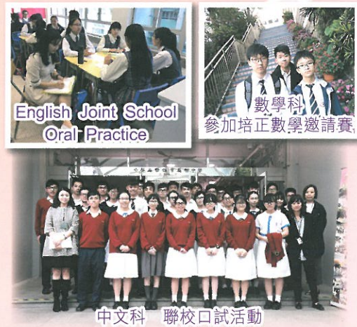
中文科 聯校口試活動