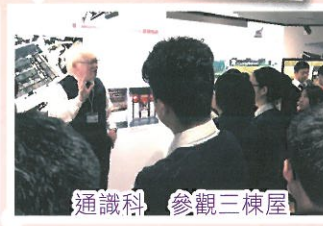
通識科 參觀三棟屋