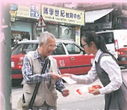
自家賀年揮春派社區

本校積極參與觀塘區學術和社區活動，既符合區會創辦基智中學五十多年以來作育英才，貢獻社區的使命，也讓學生學有所用，參與社區發展，見證觀塘蛻變。學生組織及參與義工服務，既可服務社會，建立自信，也提升對社區的歸屬感。