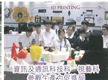
資訊及通訊科技科 視藝科 參觀生產坊促進局