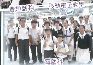
電腦科 ——參觀「2017創科博覽」