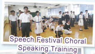
Speech Festival Choral Speaking Training