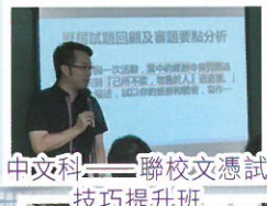
中文科 ——聯校文憑試技巧提升班