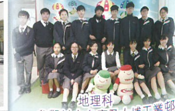
地理科 ——參觀益力多廠及大埔工業邨