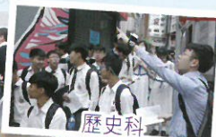
歷史科 ——中上環香港史考察

中文、英文及數學三個核心科目持續優化課程，提升學生的聽、說、讀、寫能力、運算效能及網上自學能力，配合多樣化的學習經驗，如朗誦、中文作家培訓、交流學習及各種支援閱讀計劃，鞏固學生基礎，提升學習自信。透過調適課程、集體備課、課堂研究、公開課和同儕觀課，改善不同科目的教學策略，提升教師專業發展，並促進學生的學習效能。