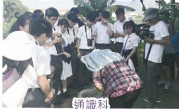
通識科 ——探索魚塘生態及文化之旅