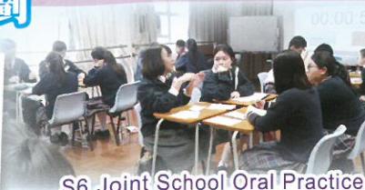
S6 Joint School Oral Practice