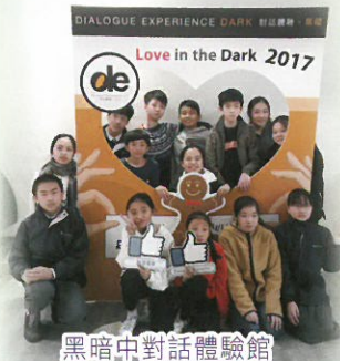
黑暗中對話體驗館

學校關注學生身心的健康成長，希望培育他們成為「樂於學習、善於溝通、勇於承擔、敢於創新」的終身學習者。生命教育委員會（LEC）透過不同的活動和教材，教導學生肯定生命的價值，接受生命的獨特之處及價值，並學習享受生命的過程。