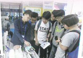
中國國際高新技術觀摩團