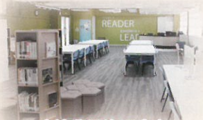
金禧學習資源中心

繼克翰電腦室、丘華有多媒體語言學習室、學校禮堂及操場後，金禧學習資源中心亦在2017年10月正式啟用，配合一系列電子資源，為同學提供更優質、更現代化的學習及閱讀環境。