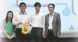
STEM創未來——建設共融及可持續發展社區講座

STEM教育是全球教育的新趨勢。本校在原有的STEM上再添加『A』（視藝Visual Arts），將之增潤成STEAM教育，並成立STEAM教育委員會，除積極優化電子學習的軟硬件，開展校本移動電子學習，提升學與教效能外，也於不同學習領域推動STEAM體驗學習，冀引發學生動機，訓練學生解難能力，以適應未來科技發展的新趨勢。