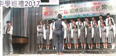
第三十二屆觀塘聯校音樂匯演