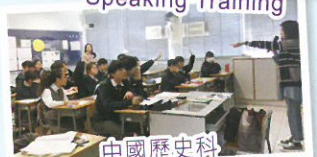
中國歷史科 ——主場中國國情教育計劃

中文、英文及數學三個核心科目持續優化課程，提升學生的聽、說、讀、寫能力、運算效能及網上自學能力，配合多樣化的學習經驗，如朗誦、中文作家培訓、交流學習及各種支援閱讀計劃，鞏固學生基礎，提升學習自信。透過調適課程、集體備課、課堂研究、公開課和同儕觀課，改善不同科目的教學策略，提升教師專業發展，並促進學生的學習效能。