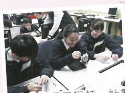
中電「校園工程師」計劃