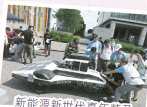
新能源新世代嘉年華及中學生太陽能車設計比賽