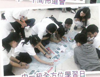
中一級全方位學習日