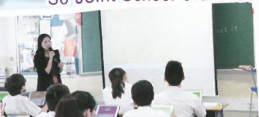
普通話科 ——移動電子教學