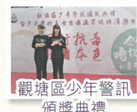
觀塘區少年警訊 頒獎典禮