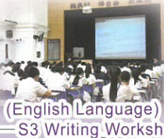
(English Language) S3 Writing Workshop

學校推行「自主學習課」，培養學生備課、完成課業及閱讀和溫習的習慣；透過學習技巧課程優化初中學生學習技巧，再配合分層課程設計和不同評估以照顧學習多元化。此外，亦透過不同形式學習活動如實地考察遊學團、寫作工作坊及聯校交流等，提升學習技能。