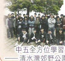
中五全方位學習日 ——清水灣郊野公園活動