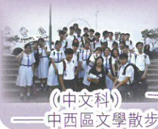
(中文科) 中西區文學散步