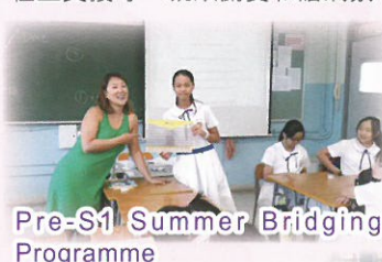
Pre-S1 Summer Bridging Programme

由訓輔組、學習支援組籌劃之中一導入課、朋輩輔導計劃、各式興趣、社交及領袖訓練小組，令新生適應校園生活之餘，發揮個人潛能；配合班級經營、課外活動、義工服務、信仰傳道和社工支援等，凝聚關愛和諧氣氛。