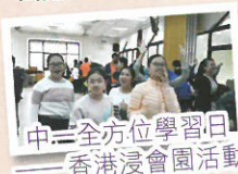
中二全方位學習日 ——香港浸會園活動

課外活動組籌劃「全方位學習日」，讓學生延伸課堂所學，擴闊視野，豐富生活體驗。例如中一級浸會園活動建立互助合作精神；中二級透過海洋公園幕後之旅認識職場實況；中三學生透過生涯規劃活動認識未來路向。中四級的赤柱正灘活動和中五級的清水灣郊野公園活動，讓學生透過多元化活動認識友儕，增進友誼。