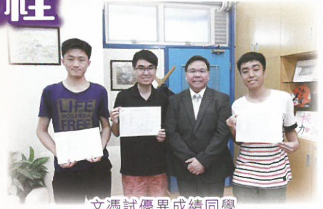
文憑試優異成績同學