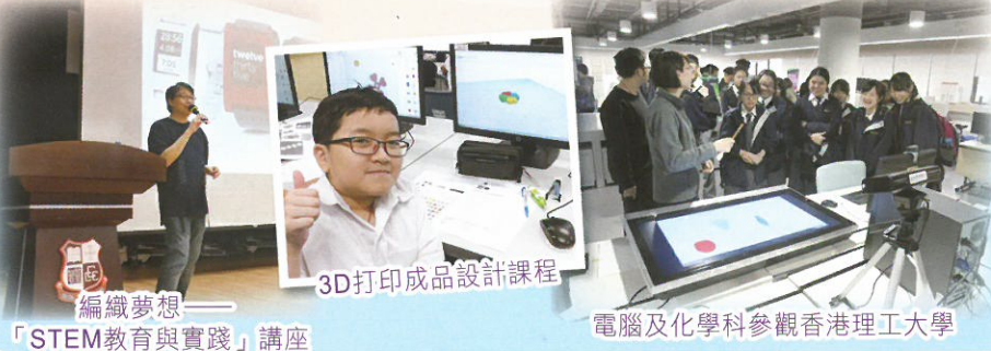
3D打印成品設計課程

近年教育界積極發展STEM教育，本校在原有的STEM上再添加「A」(視藝Visual Arts)，將之增潤成STEAM教育，除運用政府津貼及優質教育基金積極優化電子學習的軟硬件，開展校本移動電子學習，提升學與教效能外，也於不同學習領域如電腦、視藝及科學教育中推動STEM體驗學習，冀引發學生學習動機，培養探究精神，以適應未來科技發展的新趨勢。