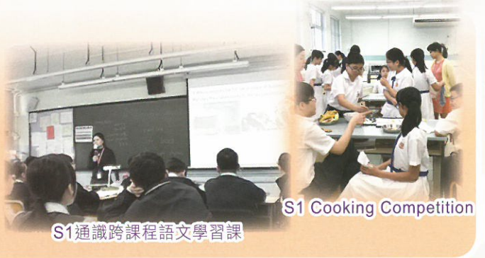
S1通識跨課程語文學習課