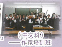
(中文科) 作家培訓班