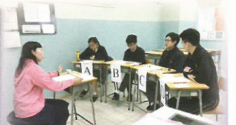
(English Language) S5 Joint School Oral Practice