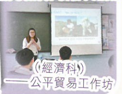
(經濟科) 公平貿易工作坊