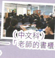
(中文科) 「老師的書櫃」