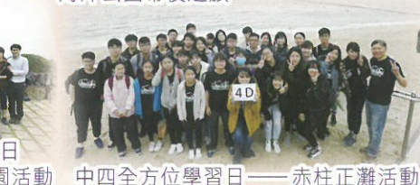
中四全方位學習日 ——赤柱正灘活動