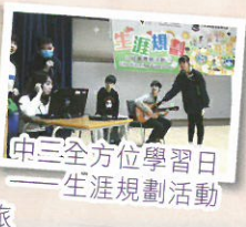
中三全方位學習日 ——生涯規劃活動