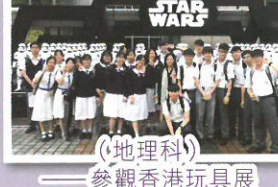
(地理科) 參觀香港玩具展