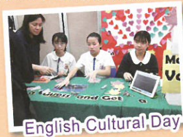
English Cultural Day