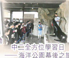
中三全方位學習日 ——海洋公園幕後之旅