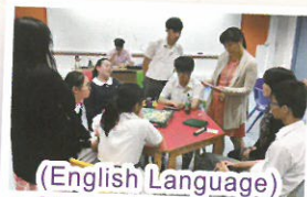
(English Language) S4 'Scrabble' Competition