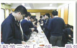
團契第三次「一領一」愛筵