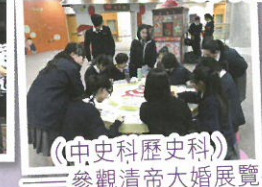
(中史科歷史科) 參觀清帝大婚展覽