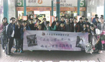
「正向心理」歷奇挑戰營