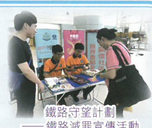
鐵路守望計劃 ——鐵路減罪宣傳活動

學校積極參與觀塘區學術和社區活動，既符合基督中學作育英才，貢獻社區的使命，也讓學生學有所為，協助社區發展，參與觀塘蛻變。學生在組織及參與義工服務的過程中能培養服務社會的精神，建立自信，提升對社區的歸屬感。