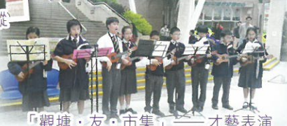
「觀塘·友·市集」——才藝表演

不論是全校的信仰培育、關顧「中一新鮮人」的適應支援、配合按校本特色設計的「全方位學習日」以至社區工作的參與，皆見本校致力實踐全人教育的目標。